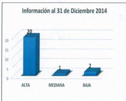
Grafico N°1 Establecimientos Públicos de atención cerrada acreditados según complejidad