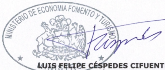
LUIS FELIPE CÉSPEDES CIFUENTES MINISTRO DE ECONOMÍA, FOMENTO Y TURISMO

Sin otro particular, saluda muy atentamente a usted,